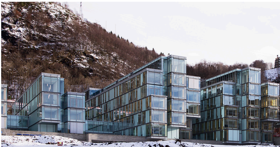
Glasblokkene, Haukeland universitetssjukehus.